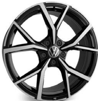
Serie su R e GTI MT Ultimate , Optional su GTI e GTD Cerchio in lega ESTORIL 8J 235/35 R19"