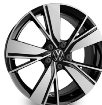
Optional su GTE e GTD Cerchio in lega BAKERSFIELD 7,5J 225/40 R18"