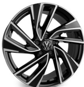
Optional su GTI, GTD Cerchio in lega ADELAIDE 8J 235/35 R19"