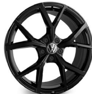
Serie su R 20 YEARS, Optional su GTI, GTI MT Ultimate e R Cerchio in lega ESTORIL Black 8J 235/35 R19"