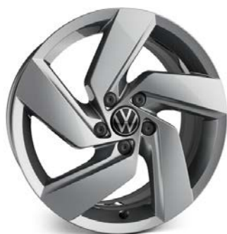
Serie su GTI GTD e GTE Cerchio in lega RICHMOND 7,5J 225/45 R17"