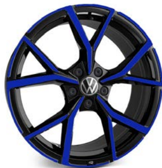
Serie su R 20 YEARS Cerchio in lega ESTORIL Blue 8J 235/35 R19"