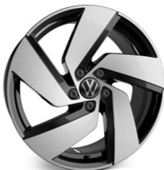
Optional su GTI Cerchio in lega RICHMOND 7,5J 225/40 R18"