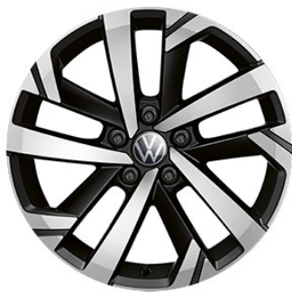
Optional su Life Cerchi in lega TORSBY black con superficie diamantata 6,5 J x 16" con pneumatici 195/55 R16 a bassa resistenza al rotolamento