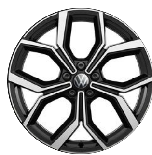
Optional su GTI Cerchi in lega FARO black con superficie diamantata 7,5 J x 18" con pneumatici 215/40 R18