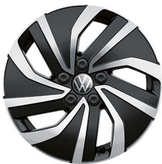
Serie su Life e Edition Plus Cerchi in lega ESSEX black con superficie diamantata 5,5 J x 15" con pneumatici 185/65 R15 a bassa resistenza al rotolamento