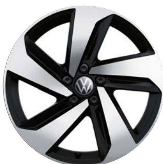
Serie su GTI Cerchi in lega MILTON KEYNES black con superficie diamantata 7,5 J x 17" con pneumatici 215/45 R17