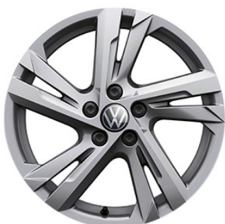
Serie su R-Line Cerchi in lega VALENCIA 6,5 J x 16" con pneumatici 195/55 R16 a bassa resistenza al rotolamento