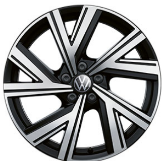
Optional su R-Line Cerchi in lega BERGAMO black con superficie diamantata 7 J x 17" con pneumatici 215/45 R17