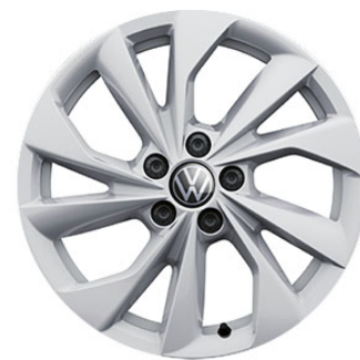
Serie su Style Cerchi in lega PALERMO verniciati in adamantium silver 6,5 J x 16" con pneumatici 195/55 R16 a bassa resistenza al rotolamento