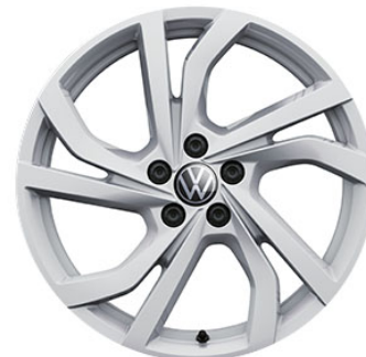
Optional su Style Cerchi in lega TORTOSA verniciati in adamantium silver 7 J x 17" con pneumatici 215/45 R17