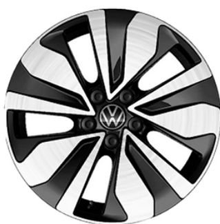
Serie su Edition Plus (alternativi a cerchi ESSEX) Cerchi in lega ZURICH black con superficie diamantata 5,5 J x 15" con pneumatici 185/65 R15 a bassa resistenza al rotolamento