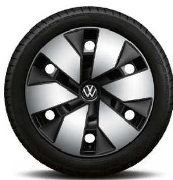
Di serie con Bi-color Exterior Style Pack

Cerchi in acciaio 7,5J x 18" con pneumatici 215/55 R18