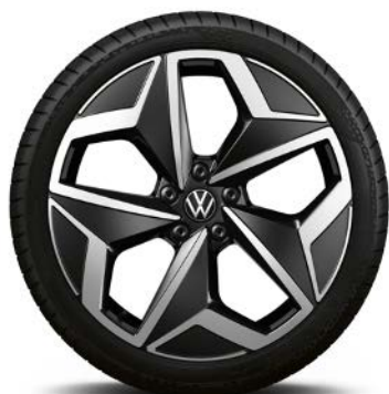
Di serie su Pro S

... non disponibili per versione Pro S ... include bulloni ruote con sistema antifurto