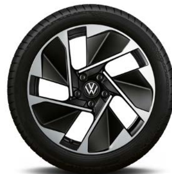
Cerchi in lega "East Derry" 7,5 J x 18" Black con superficie diamantata e pneumatici 215/55 R18

... non disponibili per versione Pro S ... solo in combinazione con pacchetti WM1 o WM2