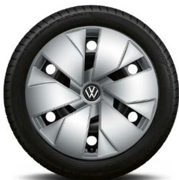
Di serie su Pure performance, Pro performance

Cerchi in acciaio 7,5J x 18" con pneumatici 215/55 R18