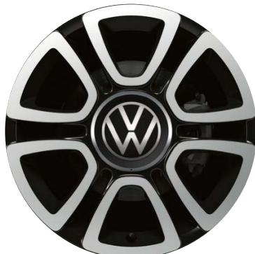
Serie su sport up! Cerchi in lega TRIANGLE 6J x 16" con pneumatici 185/50 R16"