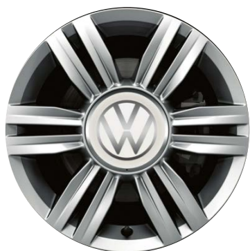
Serie su beats up! Cerchi in lega RADIAL 5,5J x 15" con pneumatici 185/55 R15"