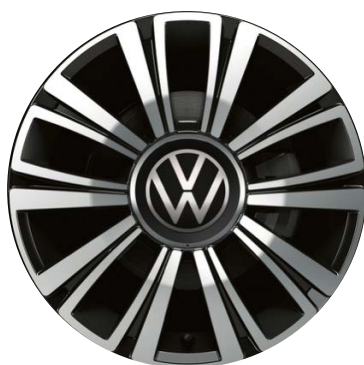
Serie su color up! Black Style Pack Cerchi in lega LA BOCA BLACK 6J x 16" con pneumatici 185/50 R16"