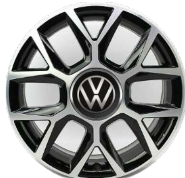
Serie su up! GTI Cerchi in lega BRANDS HATCH 6,5J x 17" con pneumatici 195/40 R17"