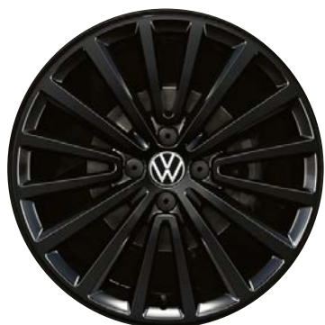
Optional per sport up! Cerchi in lega POLYGON 6,5J x 17" con pneumatici 195/40 R17"