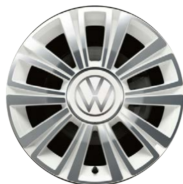
Serie su color up! White Style Pack Cerchi in lega LA BOCA WHITE 6J x 16" con pneumatici 185/50 R16"