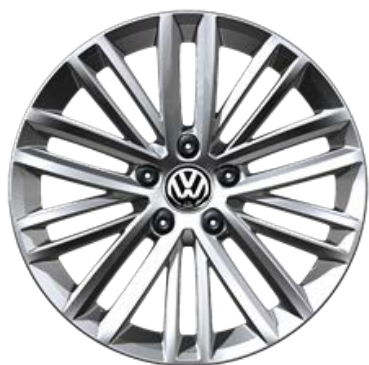
Serie su move up! Cerchi in lega FORTALEZA 5,5J x 15" con pneumatici 185/55 R15"